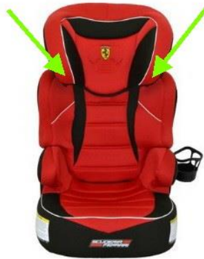
Figure 1. Emplacement des guides de ceinture épaulière

Il est possible que les étiquettes apposées sur le siège d'appoint et que les manuels d'instructions en français et en anglais distribués avec le siège n'indiquent pas la bonne configuration du guide de ceinture épaulière. En l'absence d'instructions adéquates, il est possible que la ceinture épaulière soit positionnée incorrectement, ce qui empêcherait la ceinture de glisser librement dans le guide. Les instructions révisées précisent la bonne façon de faire passer la ceinture épaulière dans le guide. Transports Canada a cerné ce problème dans le cadre du programme d'enquêtes sur les défauts après avoir reçu une plainte d'un consommateur.